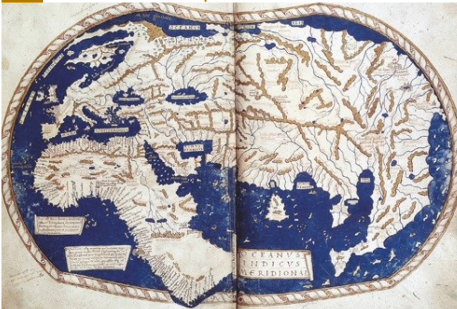
Planisphère d'Henricus Martellus, 1489. British Library, Londres.